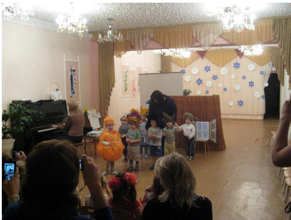
Фото 1. В гостях у сказки «Колобок»

Воспитатель: Вот и подошла к концу встреча со сказкой. Надеюсь, что и ребятам, и гостям наше сказочное путешествие очень понравилось. Примите на память о нашей встрече эти замечательные эмблемы «В гостях у сказки «Колобок»». Приглашаем всех порадоваться за наших ребят и посмотреть их достижения.